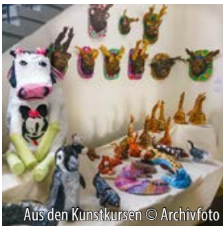
Aus den Kunstkursen