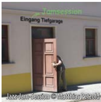
Jazz-Jam-Session © Matthias Petzold