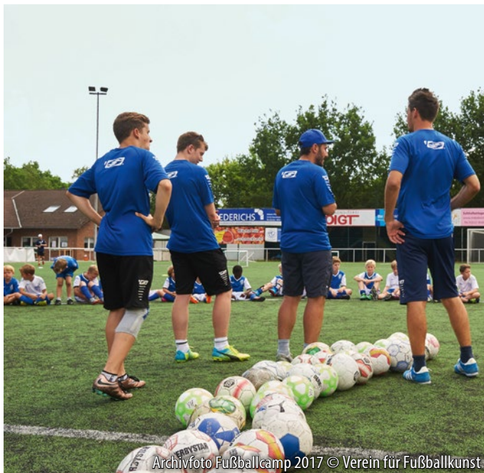
Archivfoto Fußballcamp 2017