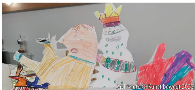
Archivfoto © Kunst bewegt 2023