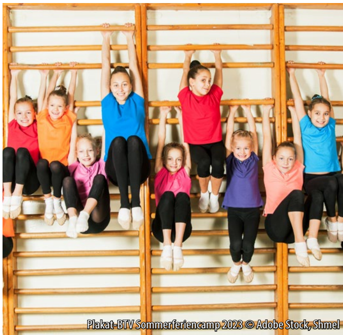
Plakat-BTV Sommerferiencamp 2023