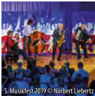
S. Musikfest 2019