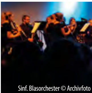
Sinf. Bläserorchester