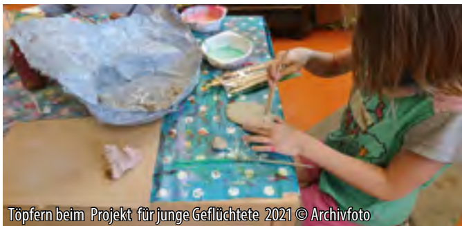
Töpfern beim Projekt für junge Geflüchtete 2021